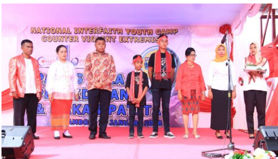
Gambar 1.3 Kegiatan Panas Pela Pendidikan oleh Kedua Sekolah pada 29 Januari 2018

Meningkatnya peredaran berita bohong akhir-akhir ini juga melanda di SMPN 9 Kota Ambon Hal ini disampaikan oleh Guru AS. Berikut uraiannya: “Sejauh ini kendalanya adalah meningkatnya berita bohong (hoaks) bernuansa Suku Agama Ras dan Antar Etnis (SARA) di media sosial, khususnya bagi peserta didik yang mempunyai smartphone dan aktif bermedia sosial. Kita masyarakat Ambon dan Maluku umumnya sudah trauma dengan namanya konflik berbau agama. kita sudah mengalaminya. dan kita tidak mau hal tersebut kembali terjadi lagi. Apalagi, kita sekarang ini sedang giat-giatnya membangun pendidikan perdamaian seperti yang dilakukan oleh SMPN 4 Salahutu Liang dan SMPN 9 Kota Ambon. Sekali lagi, kami guru-guru disini harus dapat menetralkan berita hoaks yang ada dengan mengklarifikasinya dalam pembelajaran. Kita sering mengingatkan peserta didik untuk tidak mudah mempercayai berita-berita yang bertebaran di media sosial dan mencari kebenarannya terlebih dahulu. Nah, kita tahu bahwa ilmu sosial ini sangat dinamis dan sangat penting untuk melatih peserta didik untuk berdiskusi tentang isu-isu yang berkembang, kita gunakan kesempatan itu dalam pembelajaran IPS untuk segera meredam berita-beritan bohong” (AS, 2019).