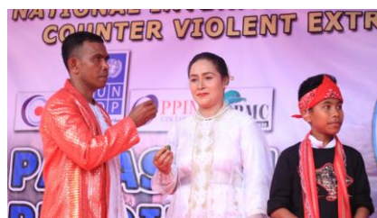
Gambar 1.2 Perwakilan Kedua Sekolah Memakan Sirih dan Kapur sebagai Ritual Panas Pela Pendidikan

siswanya beragama Kristen, sekolahnya juga berada di daerah Kristen. Kedua, SMPN 4 Salahutu Liang Kabupaten Maluku Tengah siswanya 100% beragama Islam dan lokasinya juga berada di daerah Islam. Jadi bisa kapan antar siswa bisa ketemu? Kapan? Tidak ada, kan ada pemisah, oleh karena itu kegiatan tersebut untuk menyatukan mereka. Karena alasan itu kita memilih kedua sekolah tersebut, yaitu SMPN 9 Kota Ambon dan SMPN 4 Salahutu Liang Kabupaten Maluku Tengah. Jadi begini, kita ingin menunjukkan bahwa, sebenarnya orang Maluku, orang Ambon ini mau dibilang kita ini sebenarnya saudara, tidak ada beda, mana Muslim dan Kristen, sebenarnya tidak ada perbedaan itu. Hanya karena konflik, karena kepentingan-kepentingan tertentu yah sehingga hancur terjadi konflik, yang korban siapa? Korban ini generasi sekarang ini, sehingga dipandangan mereka bahwa yang Muslim yah yang Muslim saja, yang Kristen yah yang Kristen saja” (HL, 2019).